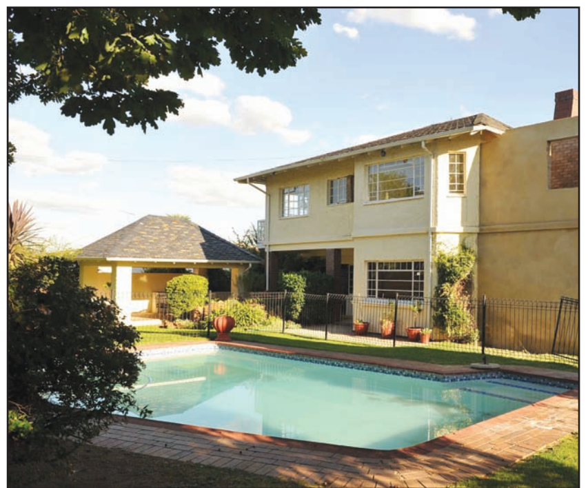
É NESTAS INSTALAÇÕES QUE VAI FUNCIONAR O LAR PORTUGUÊS DA TERCEIRA IDADE EM LINMEYER