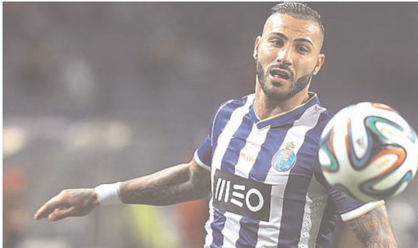
RICARDO QUARESMA NÃO FICOU FELIZ POR NÃO SER CONVOCADO PARA A SELECÇÃO DE PORTUGAL NO MUNDIAL

Tens de te habituar ao momento do futebol. Não deixando de ter o que de melhor