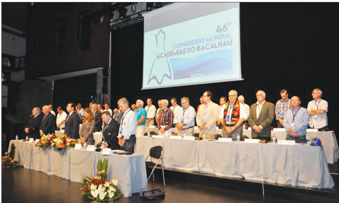
MOMENTO DE SILÊNCIO EM MEMÓRIA DOS COMPADRES E COMADRES QUE FALECERAM AO LONGO DO ANO DE 2016 E 2017. ESTE MOMENTO SOLENE ABRIU OS TRABALHOS DO 46º CONGRESSO MUNDIAL DAS ACADEMIAS DO BACALHAU, NO CENTRO CULTURAL E DE CONGRESSOS DE ANGRA DO HEROÍSMO. O EVENTO DECORREU DE 12 A 15 DE OUTUBRO NA ILHA TERCEIRA NO ARQUIPÉLAGO DOS AÇORES, PORTUGAL